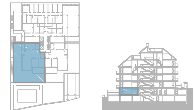
Viv. Tipo 01 _ Planta baja Puerta A

La superficie total construida (Viv. + ZZCC) incluye la superficie construida interior de la vivienda, parte proporcional de ZZCC y la superficie construida de la terraza cubierta.